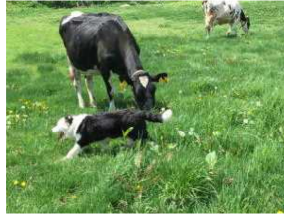
雪解けを待ちわびて