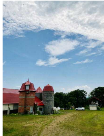
島田音楽堂サイロ

冬期間閉鎖しています、パークランド嵐山、春日青少年の家、伊勢ファームにつきましては、オープンしてからとなりますのでご了承ください。