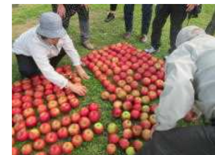
神居古潭のリンゴ狩り