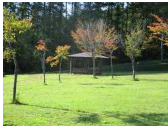
若者の郷 やまびこ広場