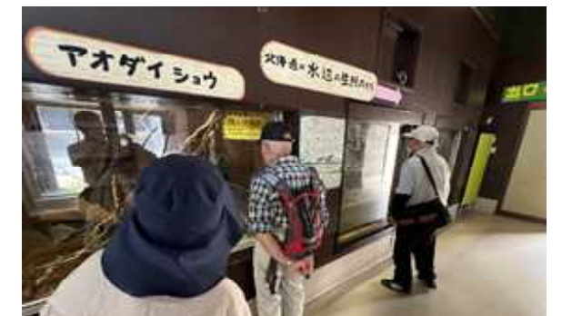
「校外研修」（7月17日） 今年は旭山動物園に行ってきました。30℃以上の晴天の日でした。