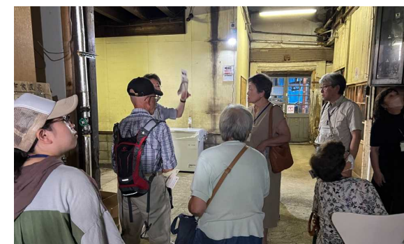
「となりまち探検隊」（8月7日） キッコーニホンの旧工場見学。歴史の変遷を店長が説明してくれました。