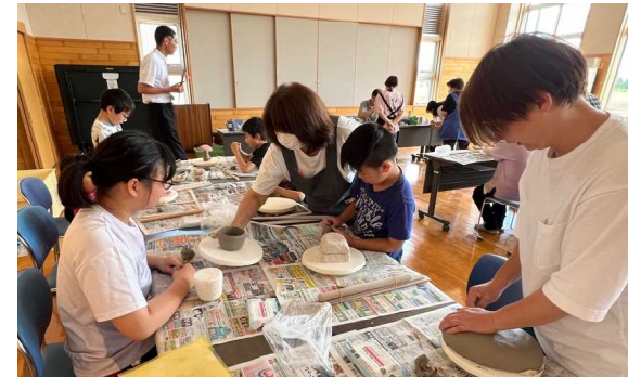
「ふれあい陶芸教室」（6月19日） 江丹別小中学校や江丹別保育所の皆さんも参加しました。