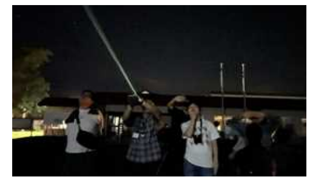
「市民天体観測会」（8月24日） 3回実施し、素晴らしい満天の星空を堪能することができました。