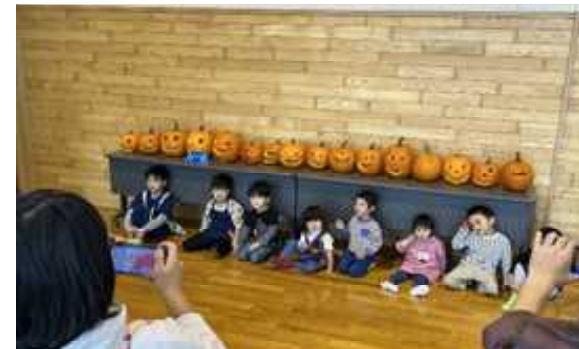
「ハロウィーンパンプキン・カービング」（10月29日） みんな上手におばけカボチャを作りました。