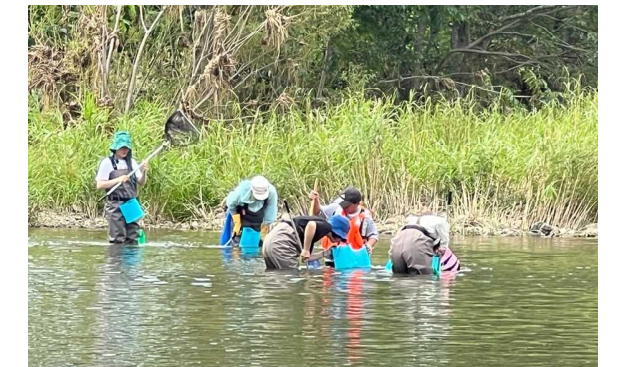
「ウチダザリガニ捕獲大作戦」（8月3日） ウチダザリガニ防除隊と一緒に江丹別川で捕獲作業をしました。