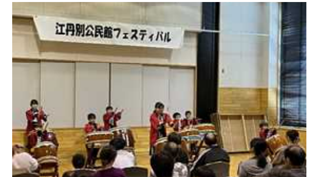
「江丹別公民館フェスティバル」（11月3日） 江丹別太鼓は迫力があり、参加者も聴き入っていました。