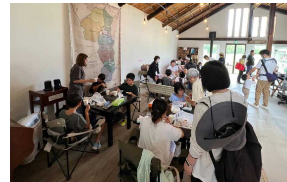
「オープンファーム」（7月28日） 旭川あらかわ牧場さんで、アイスクリーム作り体験などをしました。